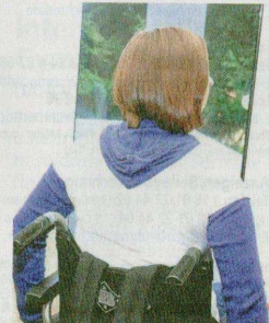
Irgendwann soll der Rollstuhl in die Ecke wandern.